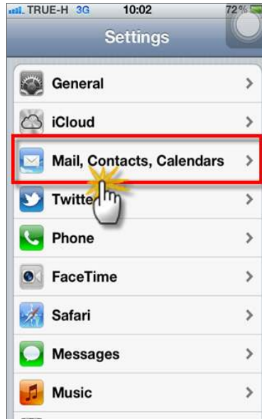
รูปภาพที่ ๒ ขั้นตอนที่๒การตั้งค่าระบบIOS

(๒) จากหน้าจอการตั้งค่า Setting ให้ผู้ใช้งานเลือกการตั้งค่าประเภทจดหมาย “Mail , Contacts , Calendars” ดังตัวอย่าง