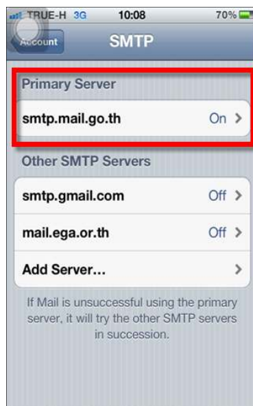
รูปภาพที่ ๑๗ ขั้นตอนที่ ๑๗ การตั้งค่าระบบ iOS

(๑๗) จากนั้นระบบจะทำการประมวลผลข้อมูลที่ได้ทำการป้อนเข้าสู่ระบบ เมื่อเสร็จสิ้นแล้วจะแสดงหน้าจอดังนี้