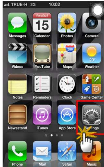
รูปภาพที่ ๑๐ ขั้นตอนที่ ๑๐ การตั้งค่าระบบ iOS

(๑๑) จากนั้น ให้ผู้ใช้งานเลือกที่เมนูการตั้งค่า Mail , Contracts , Calendars