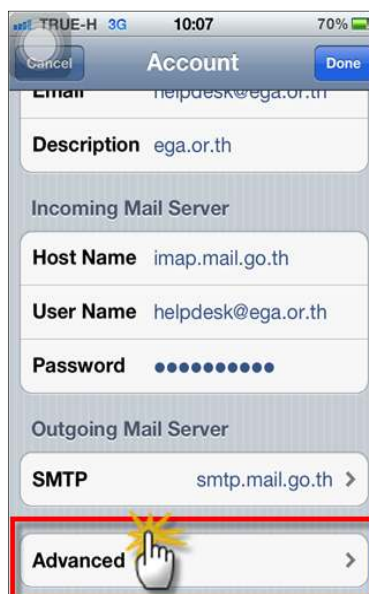
รูปภาพที่ ๑๔ ขั้นตอนที่ ๑๔ การตั้งค่าระบบ iOS