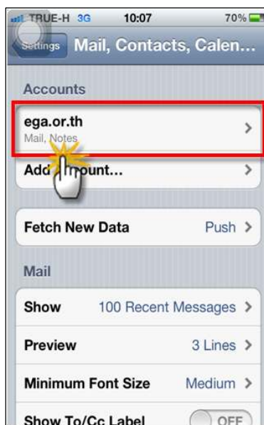
รูปภาพที่ ๑๒ ขั้นตอนที่ ๑๒ การตั้งค่าระบบ iOS

(๑๒) เมื่อเข้ามาสู่หน้าจอของการเลือกประเภท e - mail ที่ต้องการตั้งค่าการใช้งานแล้ว ให้ผู้ใช้งานเลือก “ega.or.th” ที่ได้ทำการเพิ่มเอาไว้แล้ว