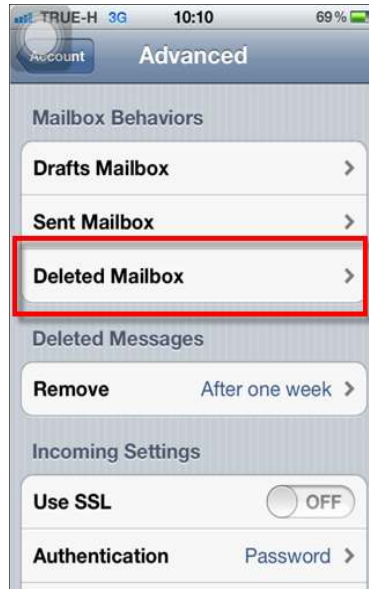
รูปภาพที่ ๒๒ ขั้นตอนที่ ๒๑ การตั้งค่าระบบ iOS

(๒๑) จากนั้น ให้ผู้ใช้งานกลับไปหน้าจอของ Mailbox Behaviors ให้ผู้ใช้งานเลือกที่ Delete Mailbox