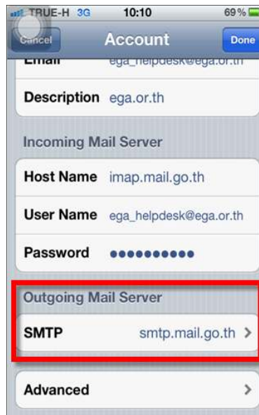
รูปภาพที่ ๑๖ ขั้นตอนที่ ๑๖ การตั้งค่าระบบ iOS

(๑๖) ในส่วนของ Outgoing Mail Server เลือก SMTP เป็น smtp.mail.go.th