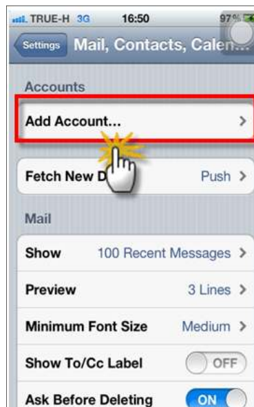
รูปภาพที่ ๓ ขั้นตอนที่๓การตั้งค่าระบบIOS

(๓) เพื่อเป็นการเพิ่มชื่อผู้ใช้งานเข้าสู่อุปกรณ์สื่อสาร ผู้ใช้งานต้องทำการเพิ่มชื่อผู้ใช้งานและที่อยู่ e - mail โดยการเลือก “Add Account”