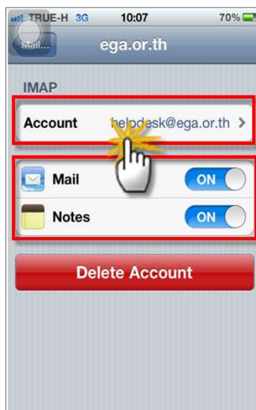
รูปภาพที่ ๑๓ ขั้นตอนที่ ๑๓ การตั้งค่าระบบ iOS

(๑๓) จากนั้นระบบจะแสดงชื่อผู้ใช้งานที่ผู้ใช้งานได้ทำการเพิ่มไว้แล้วก่อนหน้านี้ ซึ่งเป็นข้อมูลที่ต้องเปิดใช้งาน ในส่วนของ Mail และ Note ให้ผู้ใช้งานเลือกเป็น ON เพื่อทำการเปิดการใช้งานและเชื่อมต่อกับข้อมูลดังกล่าว และคลิกที่ชื่อของผู้ใช้งาน ดังตัวอย่าง