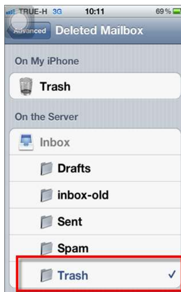
รูปภาพที่ ๒๓ ขั้นตอนที่ ๒๒ การตั้งค่าระบบ iOS

(๒๒) เลือก Trash On The Server เพื่อให้อีเมลที่ทำการลบใน iPhone Sync กับ Server Mail