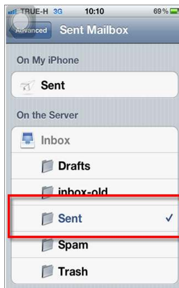
รูปภาพที่ ๒๑ ขั้นตอนที่ ๒๐ การตั้งค่าระบบ iOS

(๒๐) เลือก Sent On The Server เพื่อให้อีเมลที่ทำการส่งใน iPhone Sync กับ Server Mail