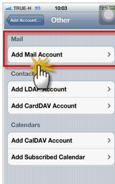
รูปภาพที่ ๕ ขั้นตอนที่๕การตั้งค่าระบบIOS