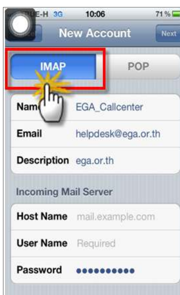
รูปภาพที่ ๗ ขั้นตอนที่๗การตั้งค่าระบบIOS