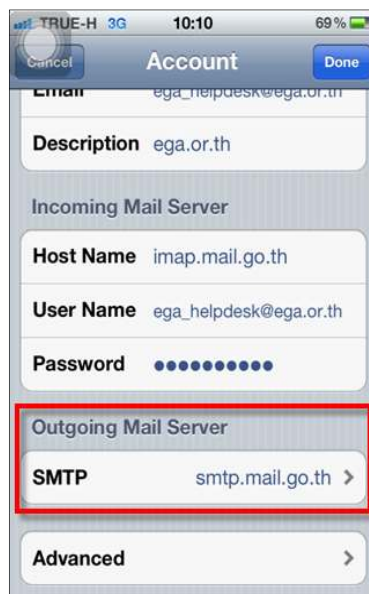
รูปภาพที่ ๑๙การตั้งค่าระบบIOS

จากนั้น หน้าจอของผู้ใช้งานจะแสดงข้อมูลดังกล่าว ให้ผู้ใช้งานเลือก Done เพื่อเข้าสู่ขั้นตอนต่อไป