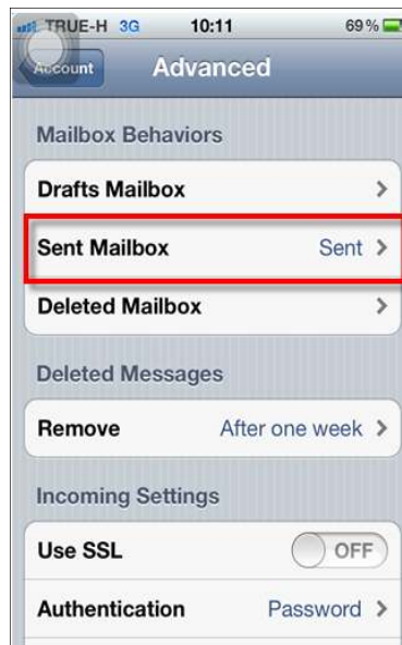
รูปภาพที่ ๒๐ ขั้นตอนที่ ๑๙ การตั้งค่าระบบ iOS

(๑๙) จากหน้านี้จะเป็นการตั้งค่าในส่วนของ Mailbox Behaviors ให้ผู้ใช้งานเลือกที่ Sent Mailbox