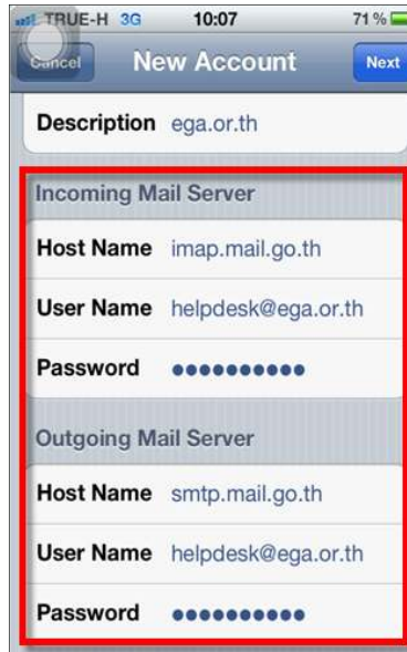
รูปภาพที่ ๘ ขั้นตอนการตั้งค่าระบบ iOS

(๘) ใส่รายละเอียด Incoming และ Outgoing Mail Server ดังตัวอย่าง เมื่อระบุรายละเอียดดังที่แสดงอยู่ในหน้าจอระบบเรียบร้อยแล้ว คลิกที่คำว่า Next เพื่อยืนยันข้อมูลและเข้าสู่ขั้นตอนต่อไป