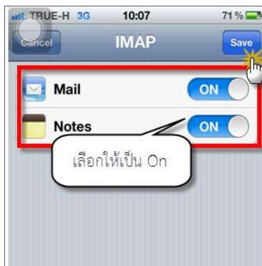
รูปภาพที่ ๙ ขั้นตอนการตั้งค่าระบบ iOS

(๙) จากนั้น ให้ผู้ใช้งานเปิดการใช้งาน โดยเลือกให้เป็นคำว่า On ในส่วนของ Mail และ Note ดังตัวอย่าง จากนั้น