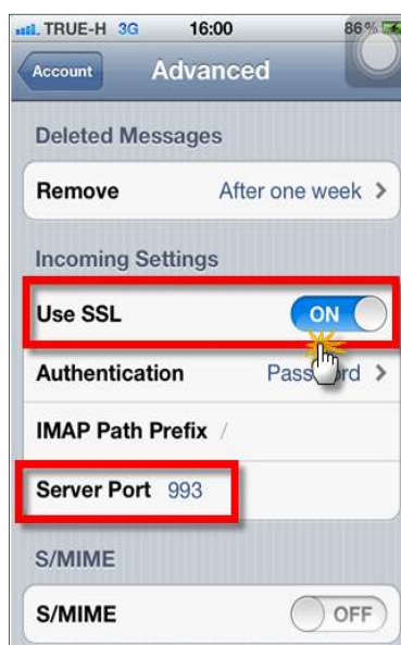
รูปภาพที่ ๑๕ ขั้นตอนที่ ๑๕ การตั้งค่าระบบ iOS