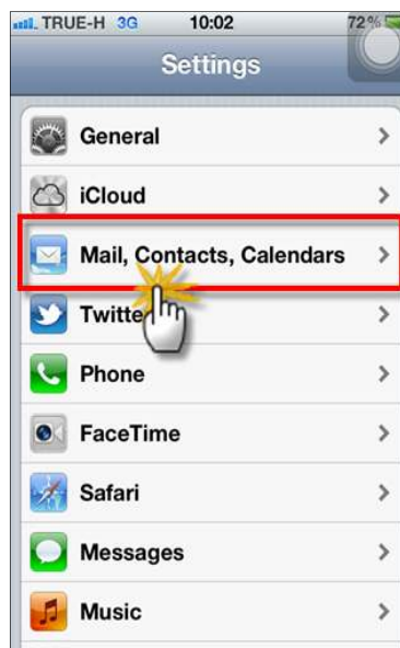
รูปภาพที่ ๑๑ ขั้นตอนที่ ๑๑ การตั้งค่าระบบ iOS

(๑๑) จากนั้น ให้ผู้ใช้งานเลือกที่เมนูการตั้งค่า Mail , Contracts , Calendars