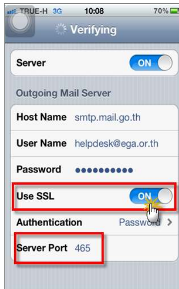
รูปภาพที่ ๑๘ ขั้นตอนที่๑๘การตั้งค่าระบบIOS

(๑๘) ขั้นตอนต่อไป ผู้ใช้งานเลือก Use SSL ให้เป็น On และ Server Port เป็น 465 ดังตัวอย่าง