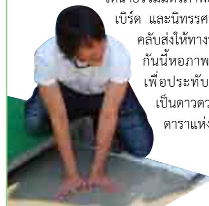
ภาพยนตร์สนทนา “เรื่องของโบลาน”