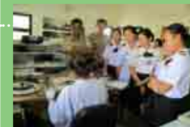
วันที่ 31 พฤษภาคม กรมยุทธศึกษาทหารเรือ กองทัพเรือ เข้าเยี่ยมชมหอภาพยนตร์ (องค์การมหาชน)