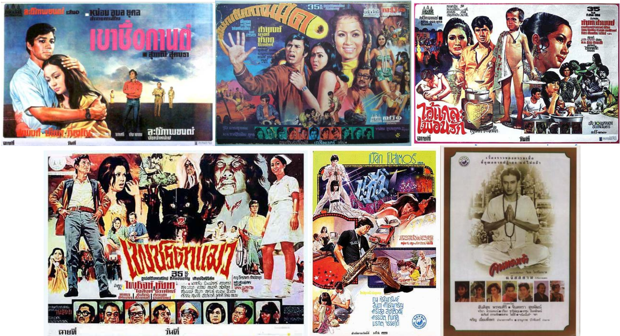
Figure 5 ภาพใบปิดภาพยนตร์ที่ทำการอนุรักษ์