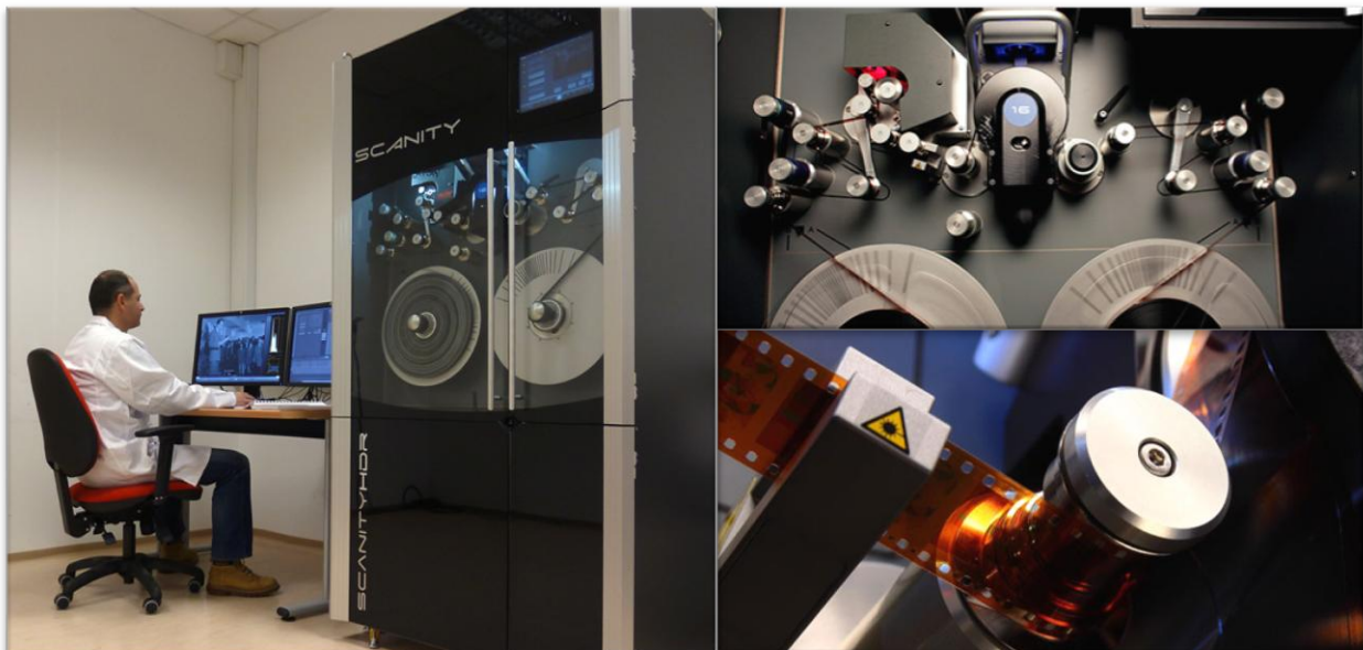
Figure 2 อุปกรณ์อนุรักษ์สื่อโสตทัศนระบบดิจิทัล