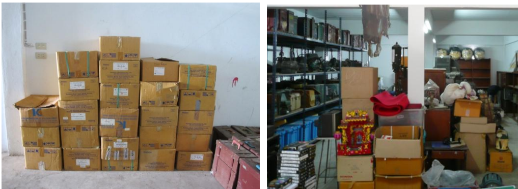
Figure 3 การจัดจำแนกประเภทภาพยนตร์ สื่อโสตทัศน์และสิ่งเกี่ยวเนื่องต่างๆ

โครงการชำระค่างจัดเก็บ เกิดขึ้นเนื่องจากภาพยนตร์ ได้รับบริจาคฟิล์มภาพยนตร์ สื่อโสตทัศน์ และสิ่งเกี่ยวเนื่องกับภาพยนตร์เก็บสะสมไว้เป็นจำนวนมาก จึงมีแผนการปฏิบัติงานชำระกรรุดค่าง เพื่อจัดระเบียบในการเก็บรักษาสิ่งของเหล่านี้ โดยมีเป้าหมายที่จะชำระ จัดทำทะเบียนและจัดเก็บฟิล์มภาพยนตร์ สื่อโสตทัศน์ และสิ่งเกี่ยวเนื่องต่างๆ ที่อยู่ในคลังของกลุ่มงานภาพยนตร์ กลุ่มงานกิจกรรม กลุ่มงานสารสนเทศ และกลุ่มงานดิจิทัล ให้ได้ร้อยละ 30