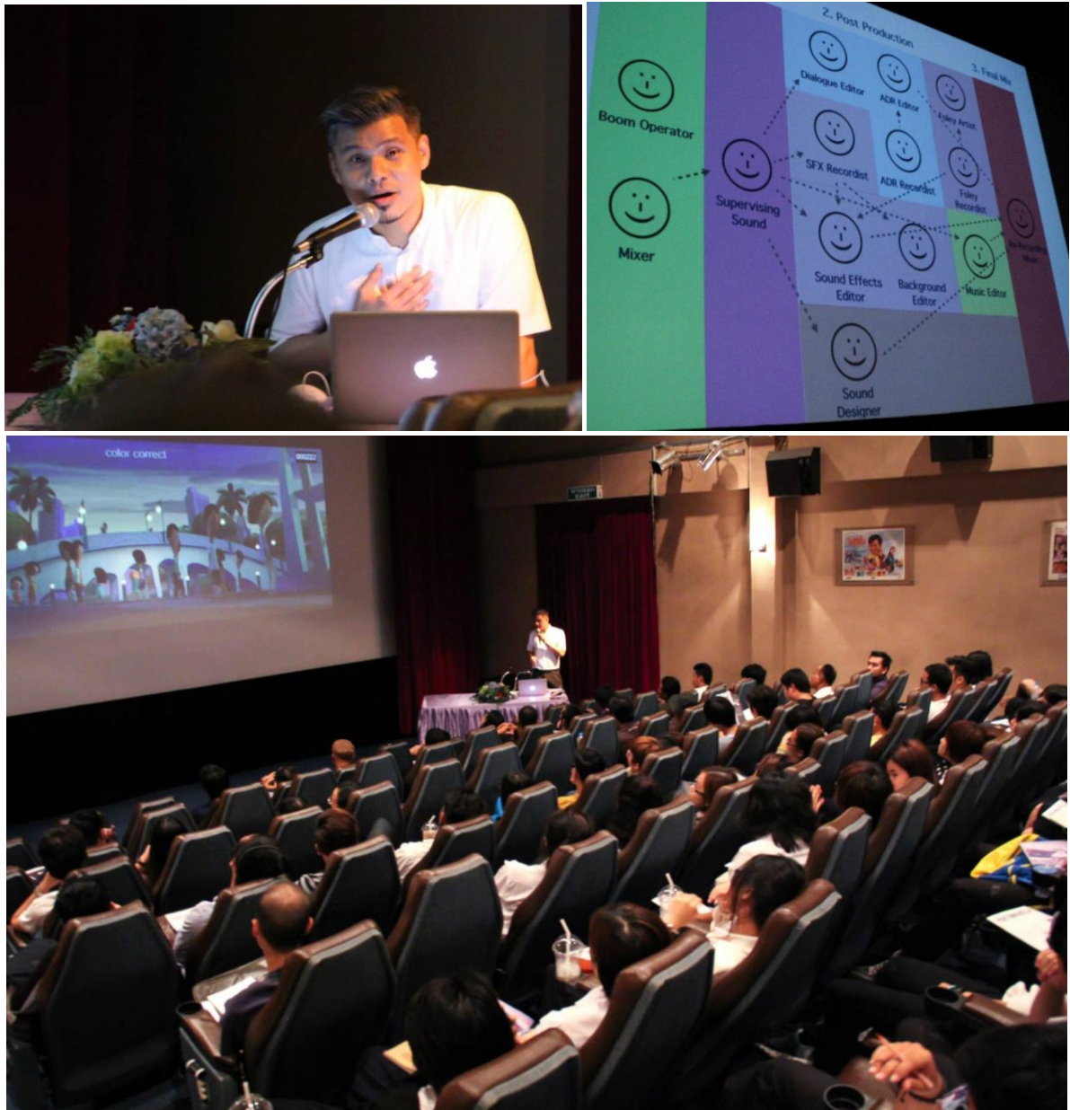
Figure 11 กิจกรรมชั้นครู MASTER CLASS ครั้งที่ 9

กิจกรรมชั้นครู 9 จัดการบรรยายหัวข้อ “เสียงในภาพยนตร์” โดย ณวัฒน์ ลิขิตวงศ์ ผู้ออกแบบเสียงและวิศวกรด้านเสียง ซึ่งมีผลงานกำกับด้านเสียงในภาพยนตร์ไทยและต่างประเทศหลายเรื่อง