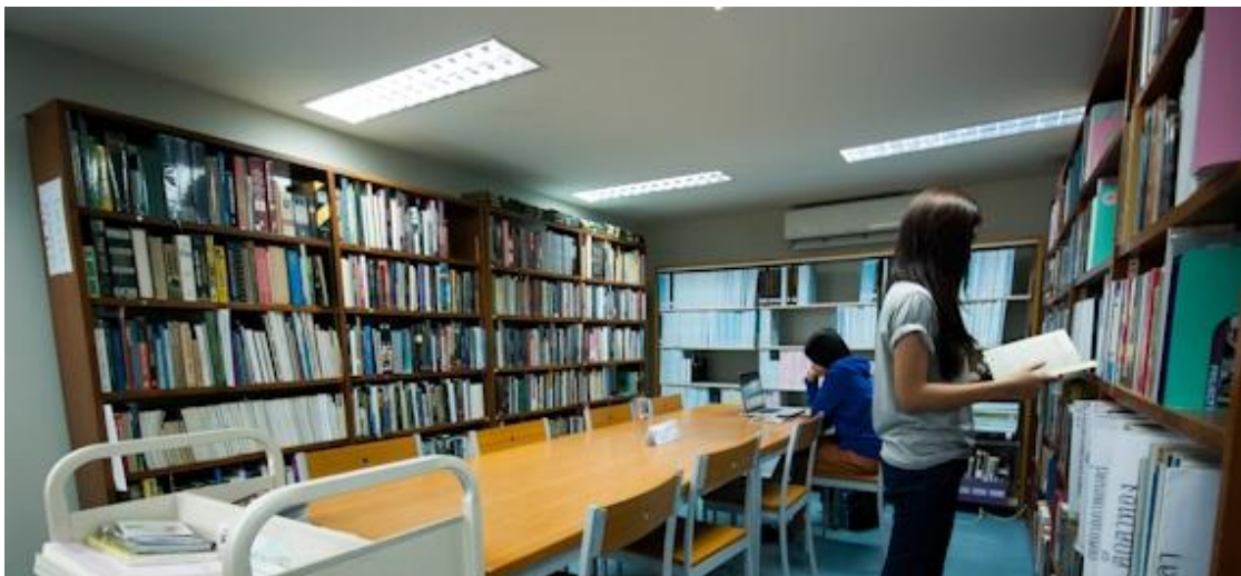
Figure 15 การให้บริการค้นคว้าข้อมูลเกี่ยวกับภาพยนตร์ งานห้องสมุดและโสตทัศนสถาน เขต ทรงศรี