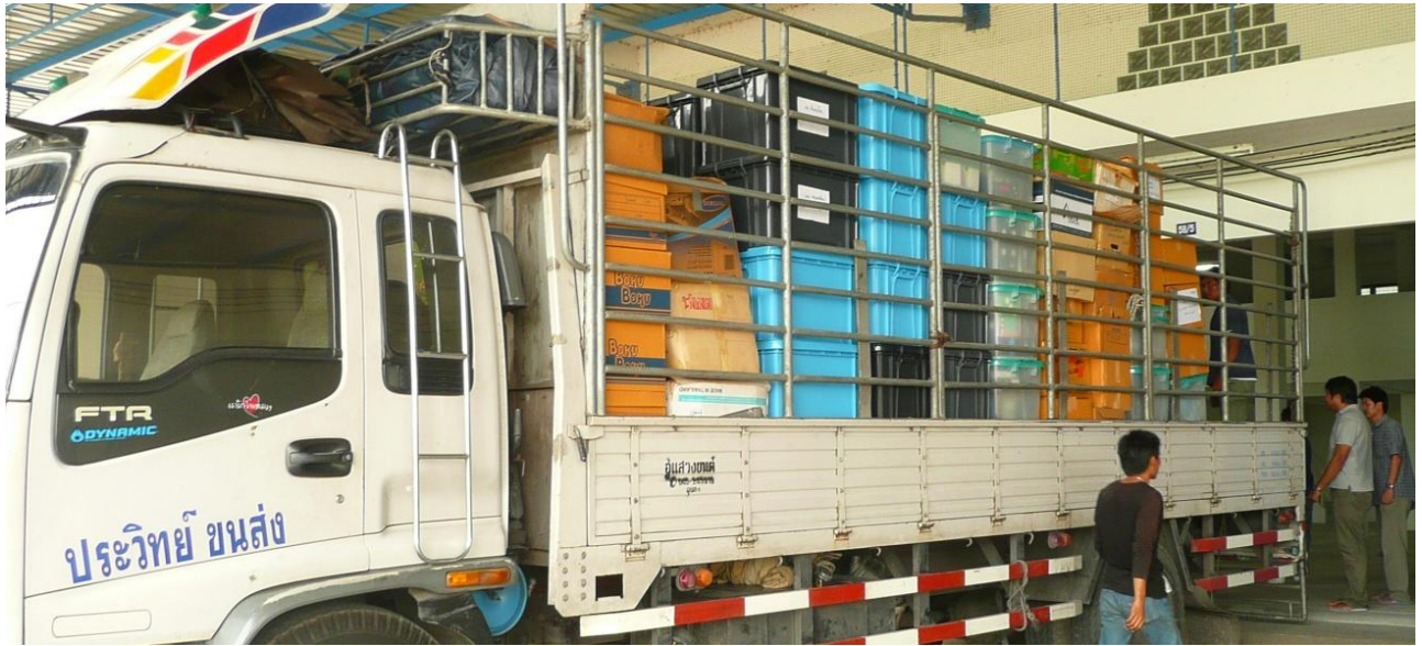
Figure 4 การชำระกรุดค้างในโกดังจัดเก็บภาพยนตร์