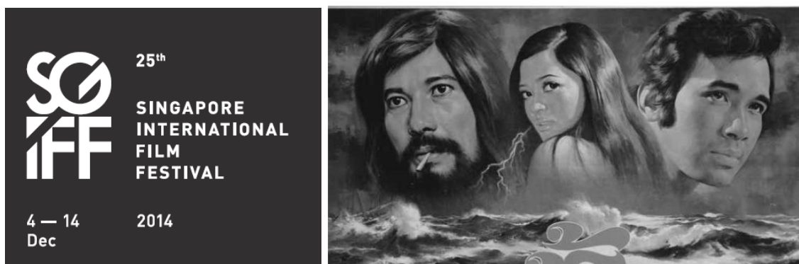
Figure 6 จัดฉายภาพยนตร์ เรื่อง ชู้ (2515) ในเทศกาล SGIFF 2015

หอภาพยนตร์ทำการจัดฉายภาพยนตร์ เรื่อง ชั่วฟ้าดินสลาย (2498) ที่ผ่านการบูรณะเรียบร้อยแล้ว ในโครงการรถโรงหนั่งที่ออกเดินทางไปฉายภาพยนตร์ให้ประชาชนในพื้นที่ห่างไกลโรงภาพยนตร์ได้ชม และได้รับ เกียรติให้นำภาพยนตร์เข้าร่วมฉายในเทศกาลภาพยนตร์นานาชาติสิงคโปร์ ครั้งที่ 25 (Singapore International Film Festival) ระหว่างวันที่ 4 -14 ธันวาคม 2558 เนื่องในโอกาสฉลองครบรอบ 30 ปี หอภาพยนตร์จึงนำ ภาพยนตร์ไทย เรื่อง ชู้ (2515) และวัยอลวน (2519) เข้าร่วมฉายในเทศกาลภาพยนตร์