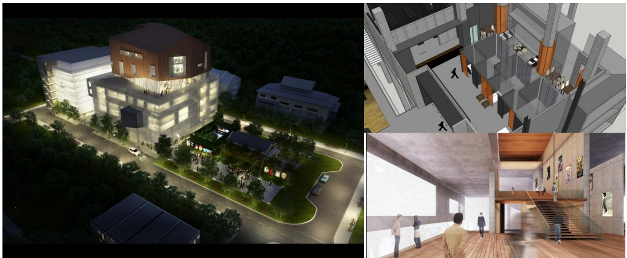
Figure 1 อาคารศูนย์อนุรักษ์และบริการสื่อโสตทัศนแห่งชาติ

อาคารศูนย์อนุรักษ์และบริการโสตทัศนแห่งชาติ มีเป้าหมายในการทำสัญญาก่อสร้างให้สำเร็จภายในปีงบประมาณ 2558 ซึ่งได้ดำเนินการทำสัญญาและเริ่มงานก่อสร้างแล้ว ตั้งแต่วันที่ 12 กุมภาพันธ์ 2558 และมีพิธีวางศิลาฤกษ์ โดยสมเด็จพระเทพรัตนราชสุดาฯ สยามบรมราชกุมารี เสด็จฯ ทรงเป็นประธาน เมื่อวันที่ 5 มิถุนายน 2558 ที่ผ่านมา