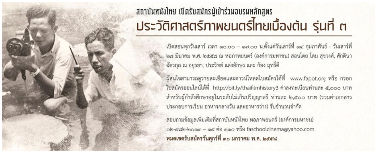
Figure 10 อบรมหลักสูตรประวัติศาสตร์ภาพยนตร์ รุ่นที่ 3

โครงการสนับสนุนการสร้างและเผยแพร่องค์ความรู้เชิงวิชาการด้านภาพยนตร์ โดยสถาบันหนังไทย หอภาพยนตร์ (องค์การมหาชน) ได้จัดอบรมหลักสูตรประวัติศาสตร์ภาพยนตร์เบื้องต้น รุ่นที่ 3 ระหว่างวันที่ 14 กุมภาพันธ์ – 28 มีนาคม 2558