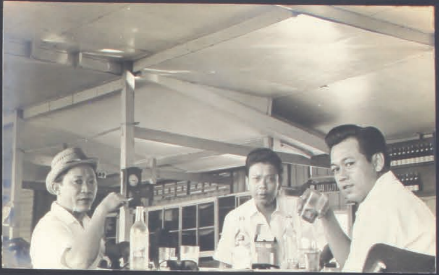
๕๕ ๒๗ อาหาร