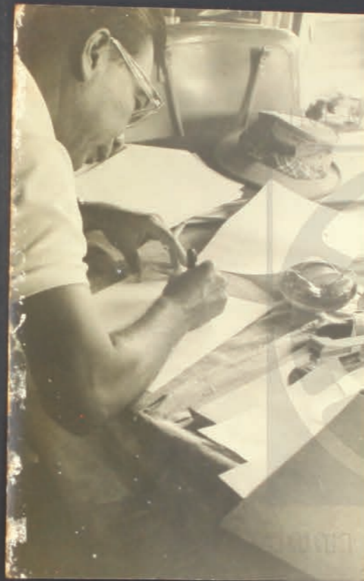
ก่อน กลอง