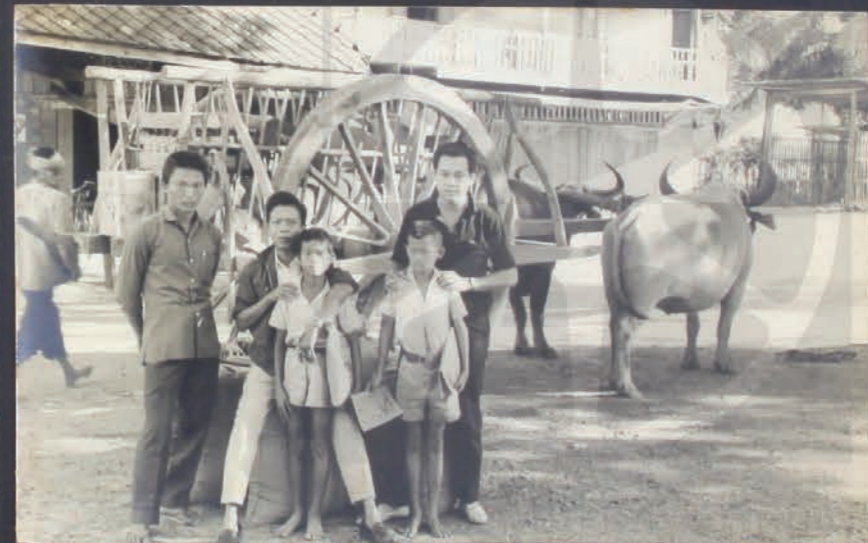
ถึงหนองแปลงยาว เอาเบียร์วางหน้า แล้วถ่ายรูปกับโคบาลเมืองไทย