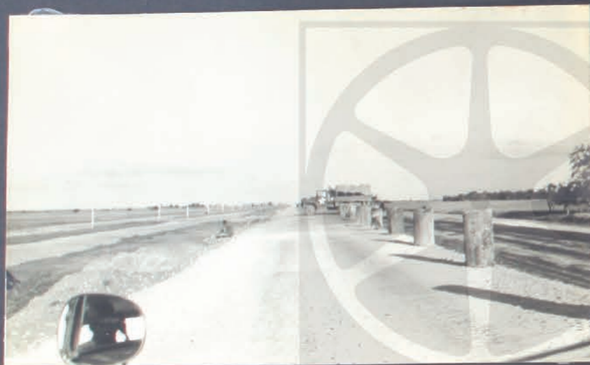
ปทุมธานี อนุปุปาโท จลจิติ