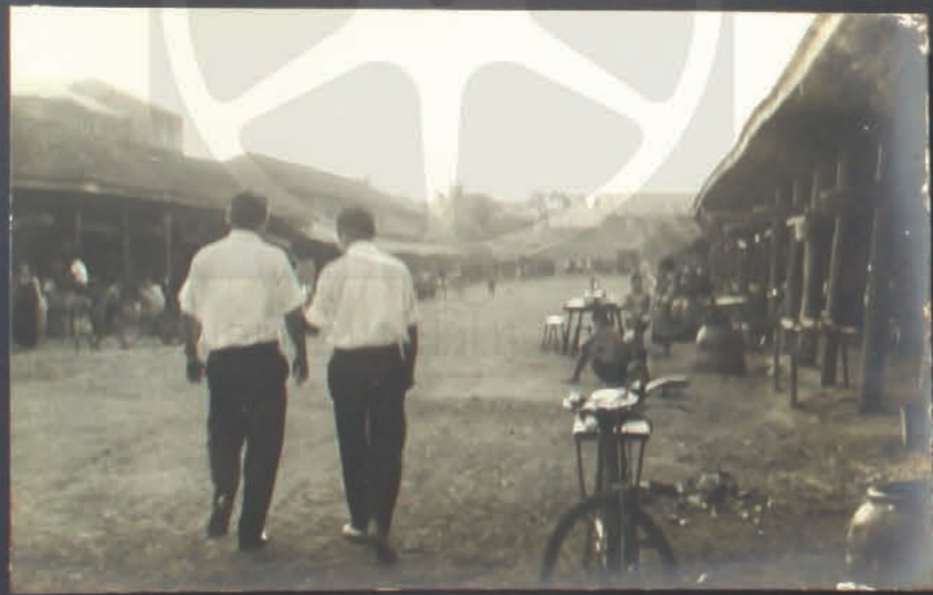
ครูวิชา สอน วางทอก