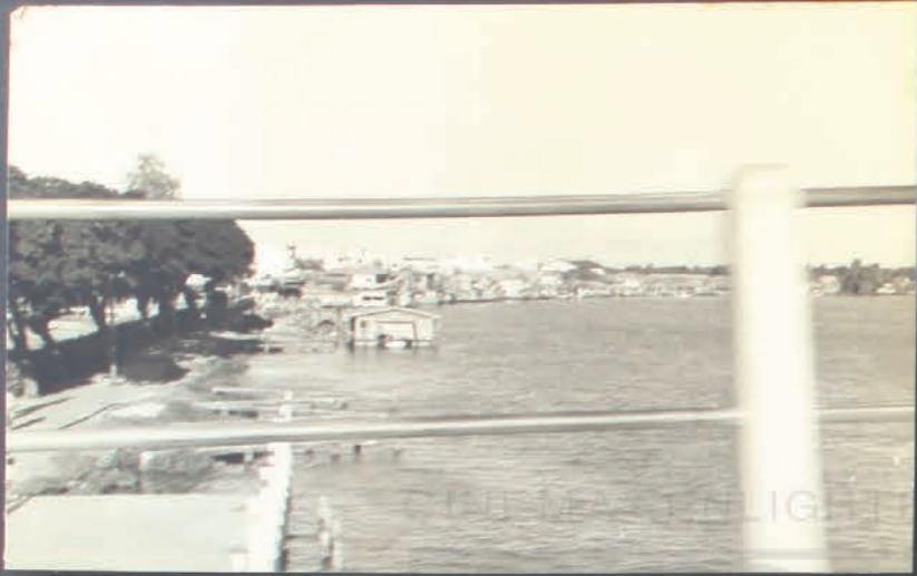
ท่าเรือ และสะพาน