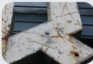
ช่องคานับขีดหลอดไฟจากค้ำคั้น