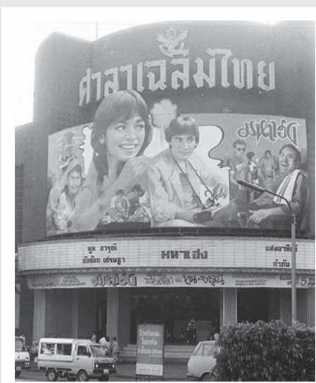
โรงหนังศาลาเฉลิมไทยในอดีต

เสมือนโล่รับกระสุน ที่ทิ้งเอาไว้ให้คอยย้ำเตือนว่าวันนั้นมันเกิดอะไรขึ้น อย่างที่สองคือ ตัวอักษรศาลาเฉลิมไทย ที่มีเสียงร่ำลือว่าอยู่ร้านรับซื้อของเก่าร้านหนึ่ง ทำให้ทุกวันนี้ หน่วยกู้หนังคิดอยู่เสมอว่าศาลาเฉลิมไทยยังไม่เคยตายจากความทรงจำ ซึ่งตอนนี้สิ่งนั้น ก็อยู่ข้างหน้านี้แล้ว