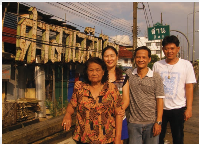
คุณนางประสาทและลูกๆ รอบตัวประสาทโสภณ